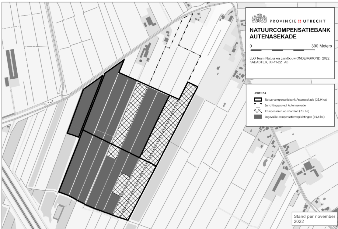
Kaart 1 Compensatielocatie Autenasekade