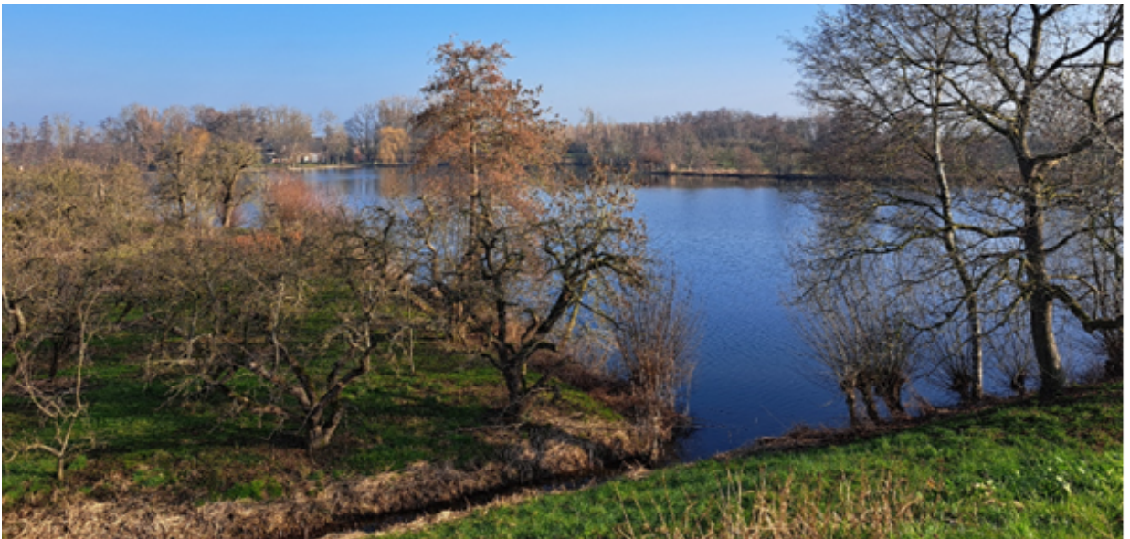
Figuur 2: Foto van een deel van het Wiel van Bassa.