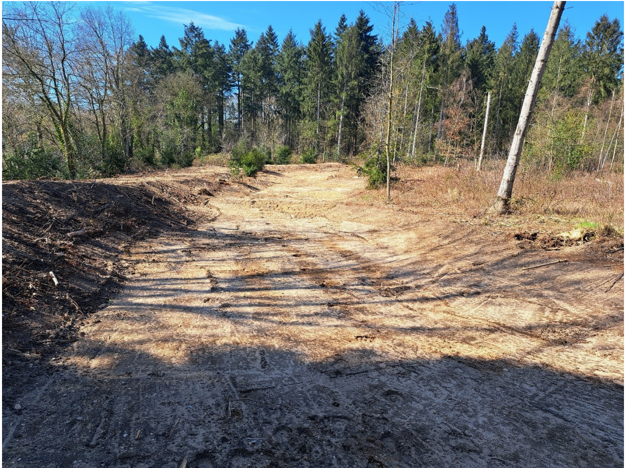
Foto van de infiltratievoorziening in het bosgebied direct ten noorden van de bebouwde kom van Amerongen.

In april van 2023 is de eerste fase van het project Klimaatbestendige Zeisterbossen opgeleverd. Dit project is niet alleen een mooie samenwerking van diverse partijen, maar ook een project waarin natuur, erfgoed, waterbeheer en recreatie bij elkaar komen en elkaar versterken. Vanuit de Blauwe Agenda is een systeemanalyse uitgevoerd om het watersysteem in beeld te brengen en te kunnen adviseren over een goede aanpak. Vanuit de Erfgoeddeal is geld ter beschikking gesteld om diverse cultuurhistorische waterwerken te herstellen, waarmee het water in de historische vijvers en sprengen beter kan worden vastgehouden. In de vervolgfase zal het water van omliggende gebouwen gebruikt worden om de sprengen en vijvers te kunnen voeden.