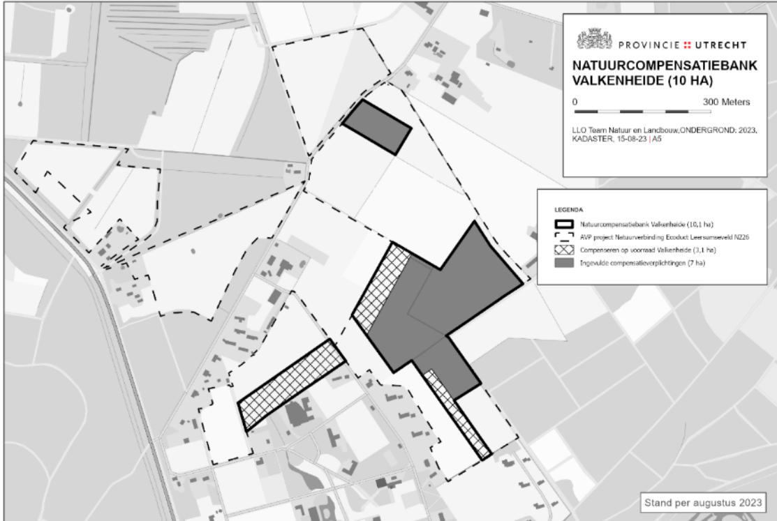
Kaart 2 Compensatielocatie Valkenheide