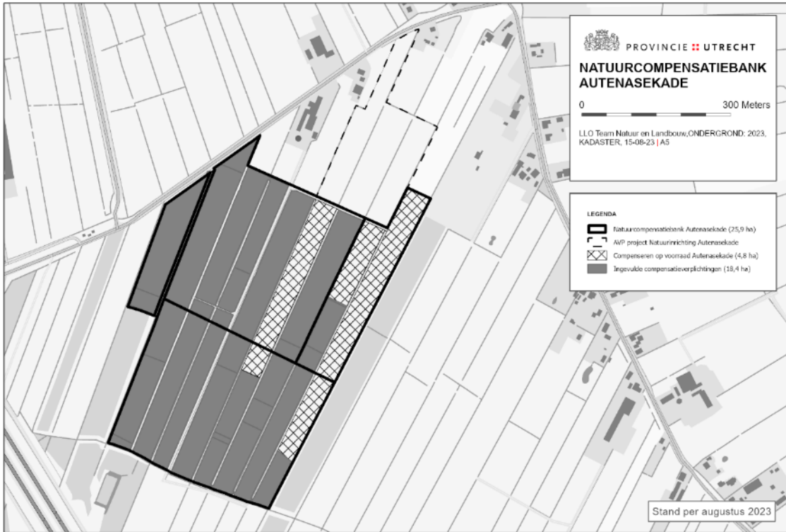
Kaart 1 Compensatielocatie Autenasekade