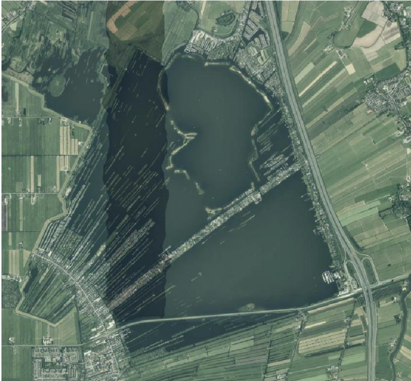
Luchtfoto planlocatie, bron: www.ruimtelijkeplannen.nl , geraadpleegd op 28 november 2023

De ontheffing kan worden verleend als de verwezenlijking van het gemeentelijk ruimtelijk beleid wegens bijzondere omstandigheden onevenredig wordt belemmerd in verhouding tot de met die regels te dienen provinciale belangen.