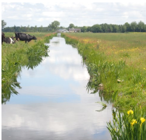
3. Natuurvriendelijke oever

Halverwege het project is er bijvoorbeeld ineens bedacht dat het baggerdepot na afloop omgezet kon worden in nat schraalland. Maar bij de start van het project was er veel tijd gestoken in het bepalen waar en hoeveel nat schraalland er zou komen. Daar waren al afspraken over gemaakt. Het baggerdepot wordt daarom ook niet omgezet naar nat schraalland.