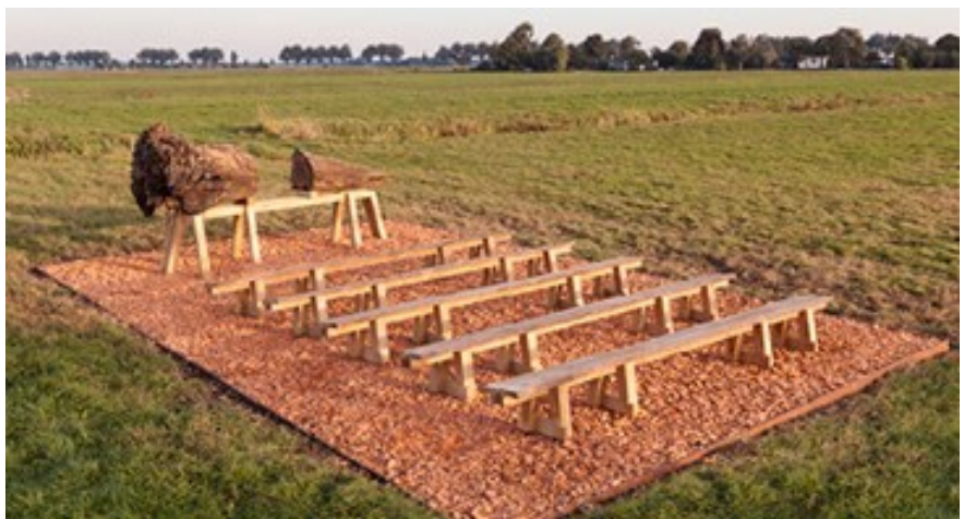
5. Kunstproject bankjes met boomstam nog in goede tijden.

Er is veel geld en tijd geïnvesteerd in het kunstproject in de Wilnis Bovenlanden. Nu ligt het er treurig bij. De vraag is of dit tijdens het proces een bijdrage heeft geleverd aan de bewustwording van de omgeving met het project en of er nu nog iets van is blijven hangen. De spreuken op de bruggen (citaten van omwonenden) zijn nog wel goed te zien, dat wordt over het algemeen wel gewaardeerd.