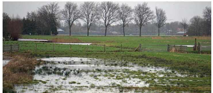
4. Inundatie door Staatsbosbeheer

Doordat er nog maatregelen nodig waren voordat het waterpeil kon worden verhoogd, is het waterpeil enkele jaren na inrichting pas omhoog gegaan. Dit heeft nadelig gevolgen gehad voor de ontwikkeling van de natuur in het gebied. Wellicht had het geholpen als hier strakkere afspraken over waren gemaakt, bijvoorbeeld in een samenwerkingsovereenkomst.