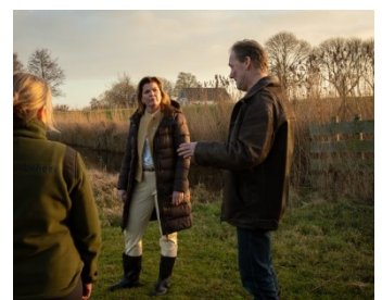
1. Bezoek minister Van der Wal aan De Wilnisse Bovenlanden

“GEEF HET GEBIED EEN PLEK OM MEE TE DENKEN.”