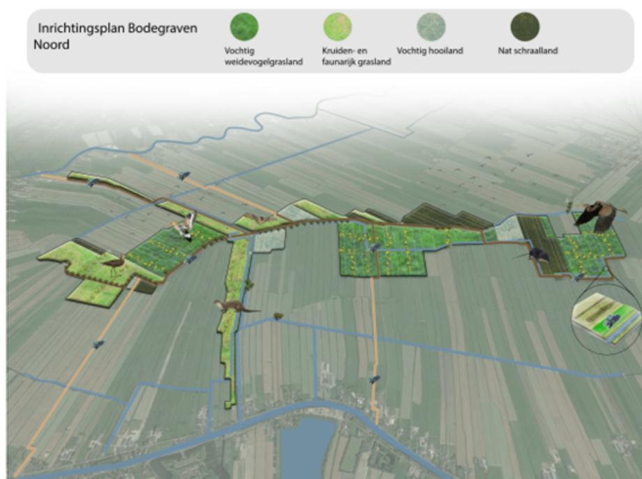
Figuur 1 Definitief inrichtingsplan 2023 Bodegraven Noord (het meest oostelijke deel betreft het NNN binnen de provincie Utrecht)