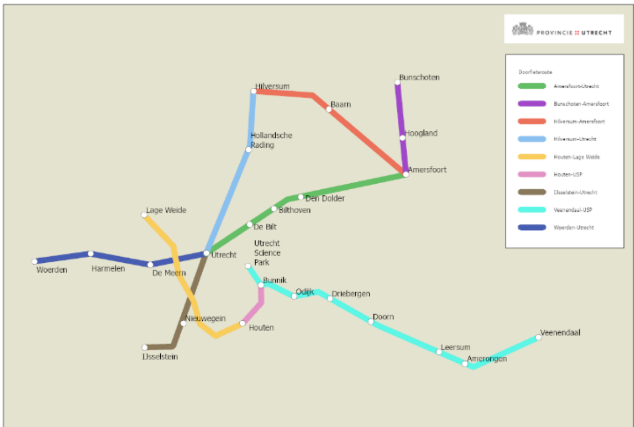
Kaart Weergave van de negen prioritaire doorfietsroutes